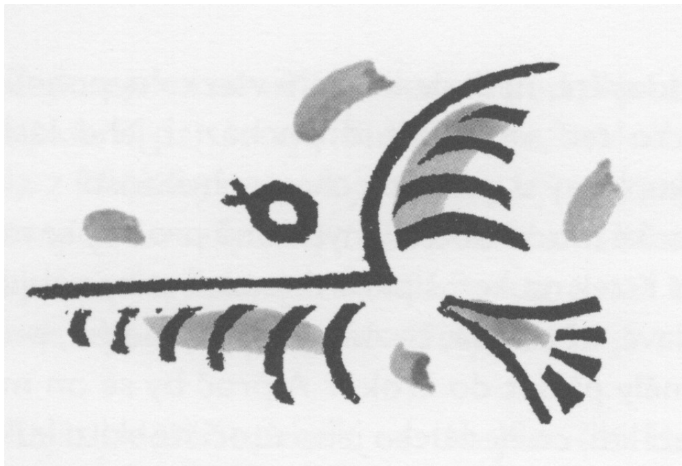
grafika Josefa Čapka